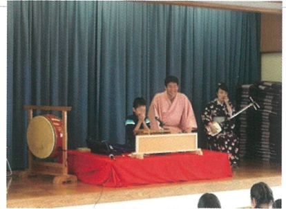
落語体験もできます!

日時 第1部：令和8年 7月25日 (土曜日) 開場 12時30分 開演 13時～